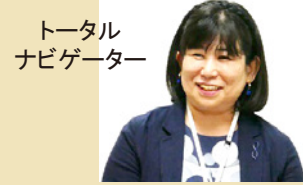
トータル ナビゲーター