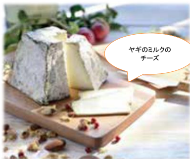
ヤギのミルクのチーズ

パンと一緒に食べると美味しいジャムやチーズ、ハムなどの+α商品も取り揃えています。