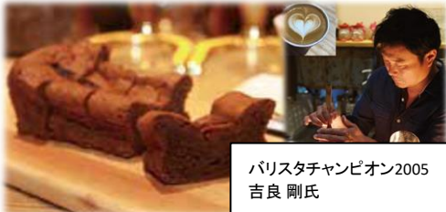
パスタチャンピオン2005 吉良 剛氏

数々の世界大会で実績のある巨匠が作るアップルパイ。 神奈川〈マルコ102〉 ①アップルパイ(1個)432円 ②シチリアレモンパイ(1個)★各日200個限り 490円